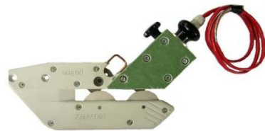
Beheizt Typ 73697/E02H